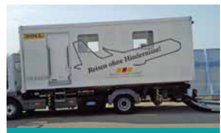
Medical Lift des Flughafen Karlsruhe