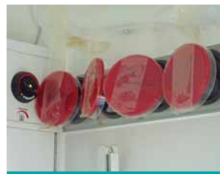
Überprüfung der Heizungsluft