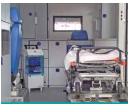
DiosolGenerator™ (Verneblungsgerät) im Fahrzeuginnern